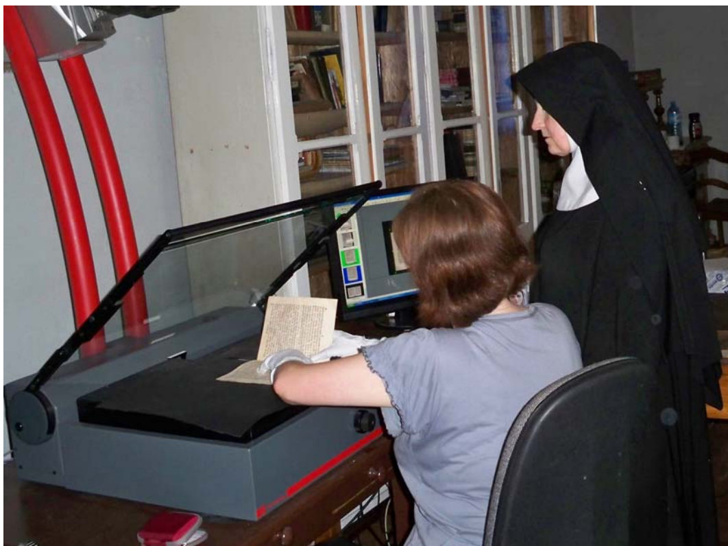
Proces skanowania rękopisów, starodruków i archiwaliów