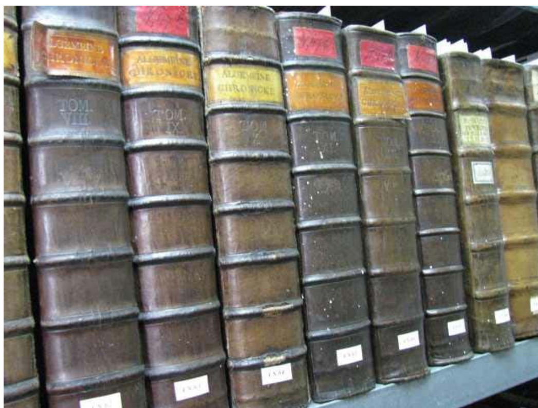
Zbiory Biblioteki WSD w Legnicy poddane digitalizacji